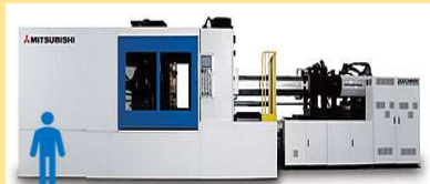
大型射出成形機 サイズイメージ